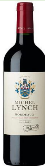
MICHEL LYNCH RAUGE