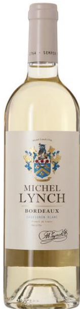
MICHEL LYNCH BLANC