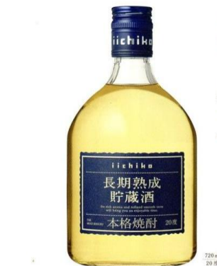
二段熟成 Iichiko | 長期熟成貯蔵酒